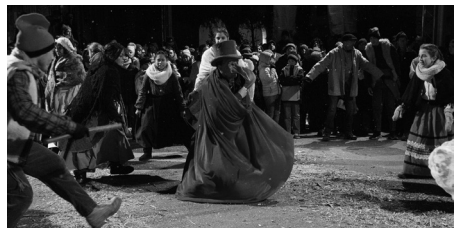
El Pessebre Vivent d'Escaldes-Engordany el 2017

El teatre popular és aquell que fa el poble per al poble. El fet que les representacions es facin en un lloc públic, habitualment dedicat a altres coses, suposa la transformació de l'espai quotidià en un lloc amb noves dimensions que acullen la representació de l'imaginari local. La representació a la plaça pública o en espais