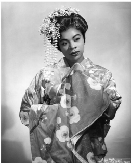
Martina Arroyo in the title role of Puccini's Madame Butterfly. Photo: Louis Milerman/Steingarten Opera Butterfly- Martina Arroyo