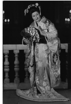
Butterfly- Montserrat Caballé