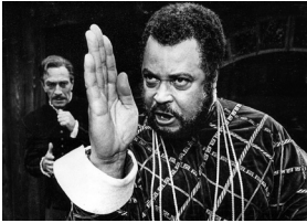
Othello – James Earle Jones