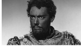
Othello- Mario Del Monaco