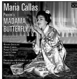
Butterfly- Maria Callas

M'he centrat en aquests tres personatges, però en trobaríem molts altres exemples per a cada personatge de la història del teatre (rei Lear, Julieta, Juli Cèsar, Tartuf, Mare Coratge...)