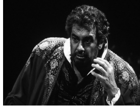
Othello- Plácido Domingo