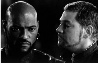
Othello - Laurence Fishburne