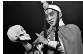
Fu Xiro, actor japonès representant Hamlet