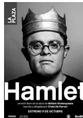
Hamlet amb actors amb capacitats especials