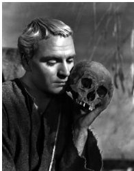
Hamlet – Laurence Olivier thredlist

M'interessa que ens fixem en com cada director, sota la mirada de la seva cultura, ha imaginat els següents personatges dramàtics universals: Hamlet, Otel·lo i Madama Butterfly. I com diferents actors els han donat vida.